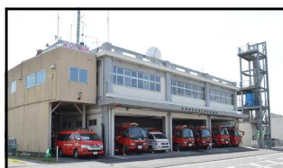
消防本部・消防署