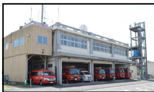
消防本部・消防署