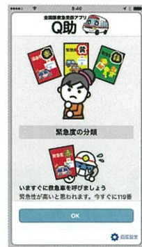
緊急度の分類説明