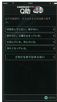
視覚効果 「明度反転」