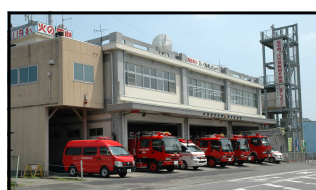
消防本部・消防署