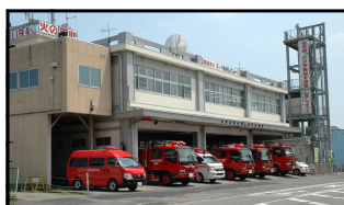
消防本部・消防署