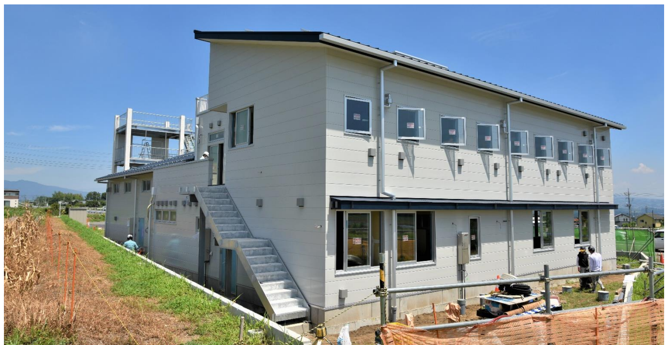
【敷地南西側から望む】