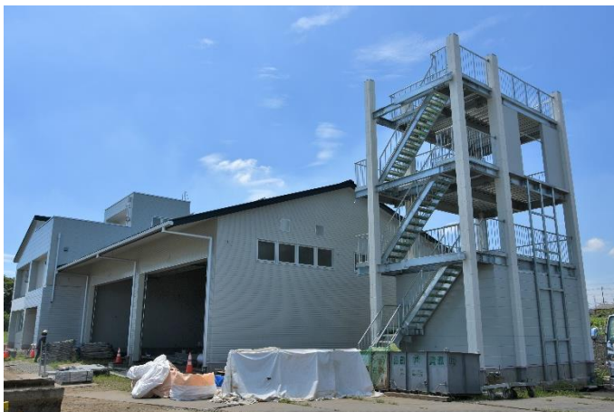
【訓練棟 敷地北東側から望む】