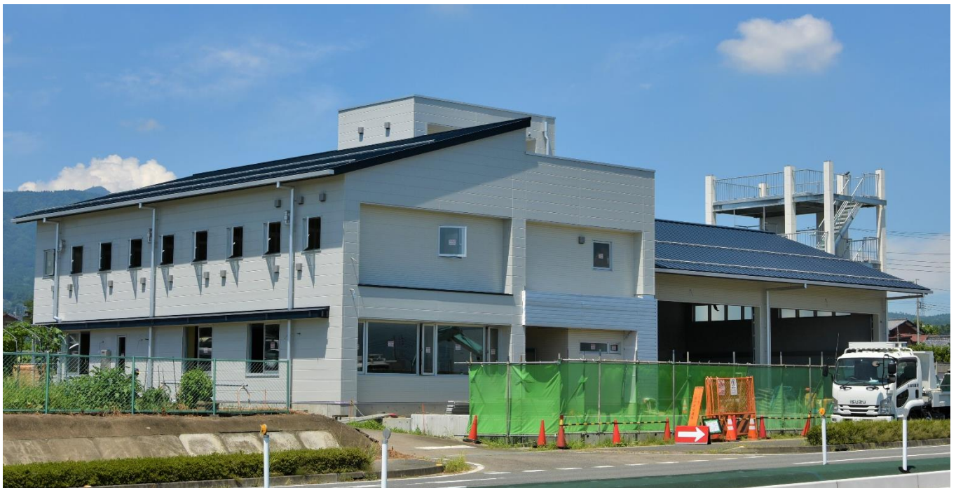
【敷地東南側から望む】

外構工事では、県道歩道上での作業も伴いますが、適切な誘導で皆さまの安全を確保しながら作業してまいりますので、ご理解とご協力の程よろしく申し上げます。